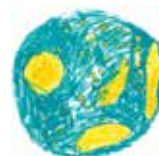
Fritz Jahr Documentation and Research Centre for European Bioethics of the University of Rijeka