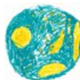
Dokumentacijsko-istraživački centar za europsku bioetiku „Fritz Jahr“ Sveučilišta u Rijeci